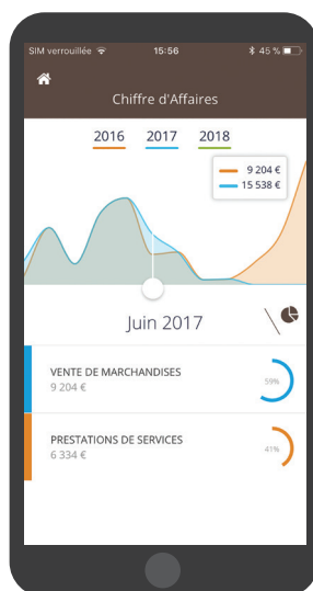
Aperçu en version mobile